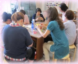
体験講習会の様子

主に地元の方の手作り品を置いている雑貨etcのお店、かだってマルシェ。現在18のお店が集まっています☆ 作家展は小さなお店を抜け出して、より作家さんの素敵な手作り品を観てもらえたらと、2014年8月に第1回を開催し、好評をいただきました。 今回も限定商品の販売や、1日限りの商品制作体験とお楽しみがたくさん！作家さんの織りなす手作り品の数々をぜひ観にきてください~ (^o^)