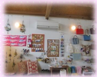
壁一面に作品がずらり♪

主に地元の方の手作り品を置いている雑貨etcのお店、かだってマルシェ。現在18のお店が集まっています☆ 作家展は小さなお店を抜け出して、より作家さんの素敵な手作り品を観てもらえたらと、2014年8月に第1回を開催し、好評をいただきました。 今回も限定商品の販売や、1日限りの商品制作体験とお楽しみがたくさん！作家さんの織りなす手作り品の数々をぜひ観にきてください~ (^o^)